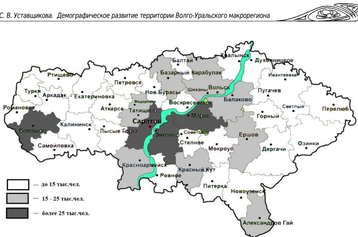
Численность сельского населения Саратовской области, 2020 г., тыс. человек

крупнее город, тем мощнее его притягательные черты).