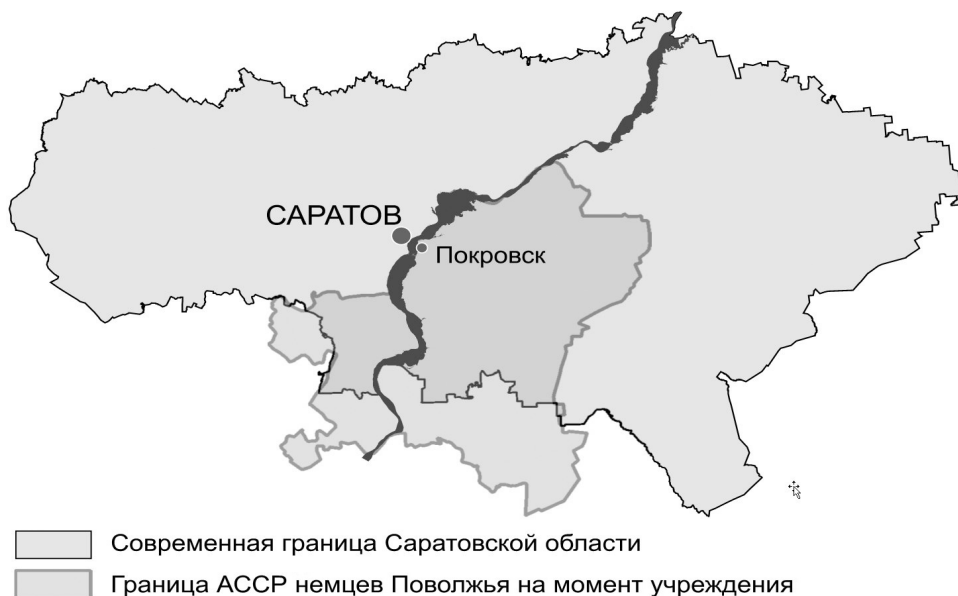
Рис. 2. Граница АССР немцев Поволжья на момент ее учреждения

Результаты анализа материалов переписи вновь отражают негативные тренды трансформации демографического пространства. За шестилетний межпереписной период регион потерял 12% населения (опять преимущественно за счет сельской местности). Особенно значительное